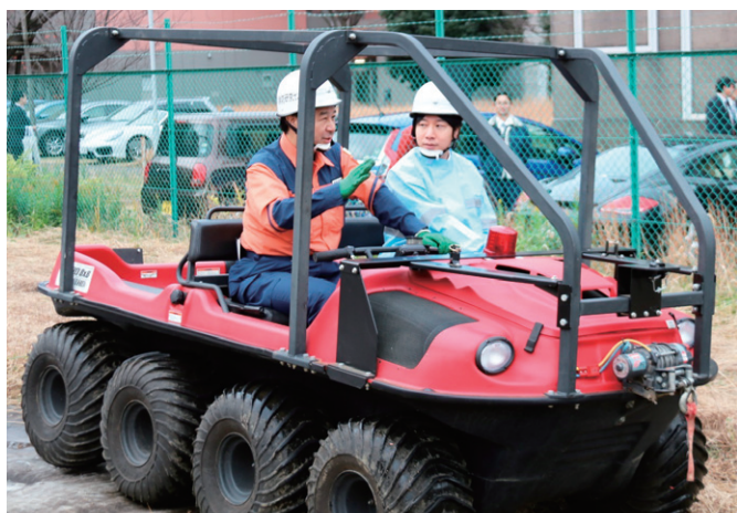
熊本地震等で活躍した、がれきや海水で立ち入り困難な津波被害現場での消火・人命救助を行う水陸両用バギーについての説明を受ける小倉総務大臣政務官（右側）