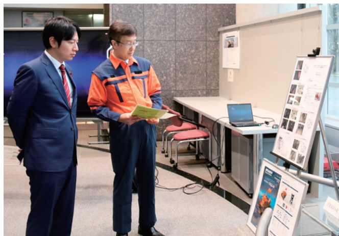
石油コンビナート等における大規模な火災等が発生し、消防隊員が現場に近づけない状況において災害の拡大抑制等を行う消防ロボットシステムについての説明を受ける小倉総務大臣政務官（左側）